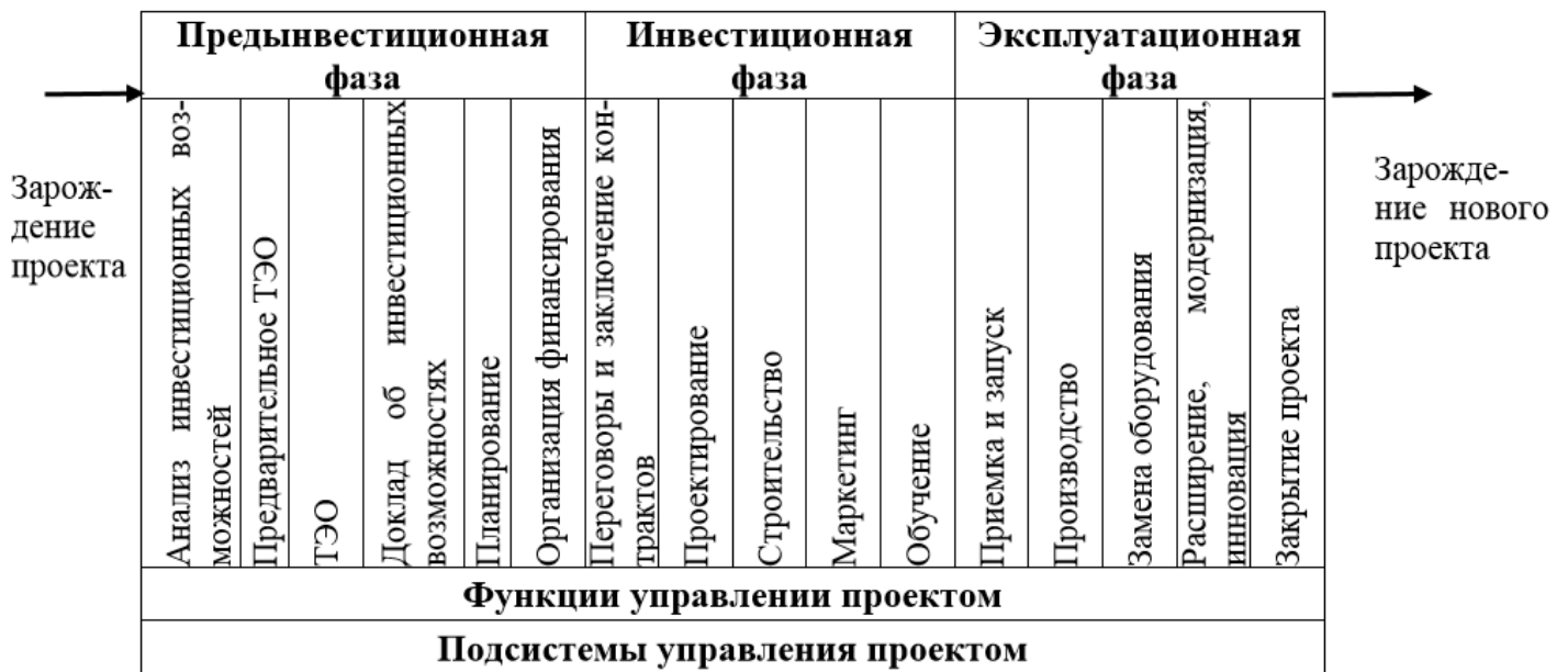
Рис. Принципиальная модель управления инвестиционным проектом